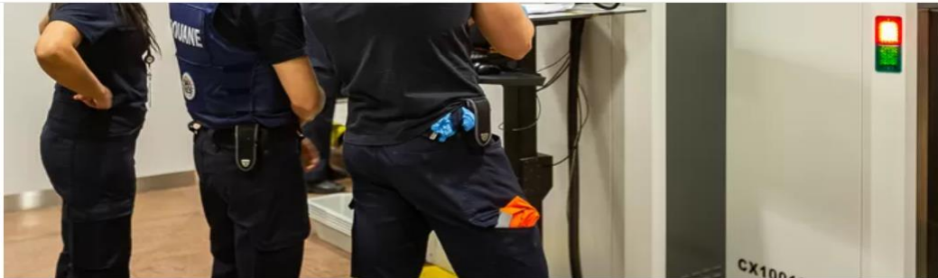
Douanepersoneel op Brussels Airport bij een scanner van het Chinese merk NuTech. Archiefbeeld.