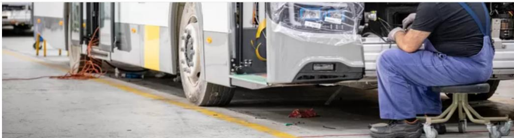
De Lijn bestelde in het verleden wel al elektrische bussen bij de Belgische bussenbouwer Van Hool.