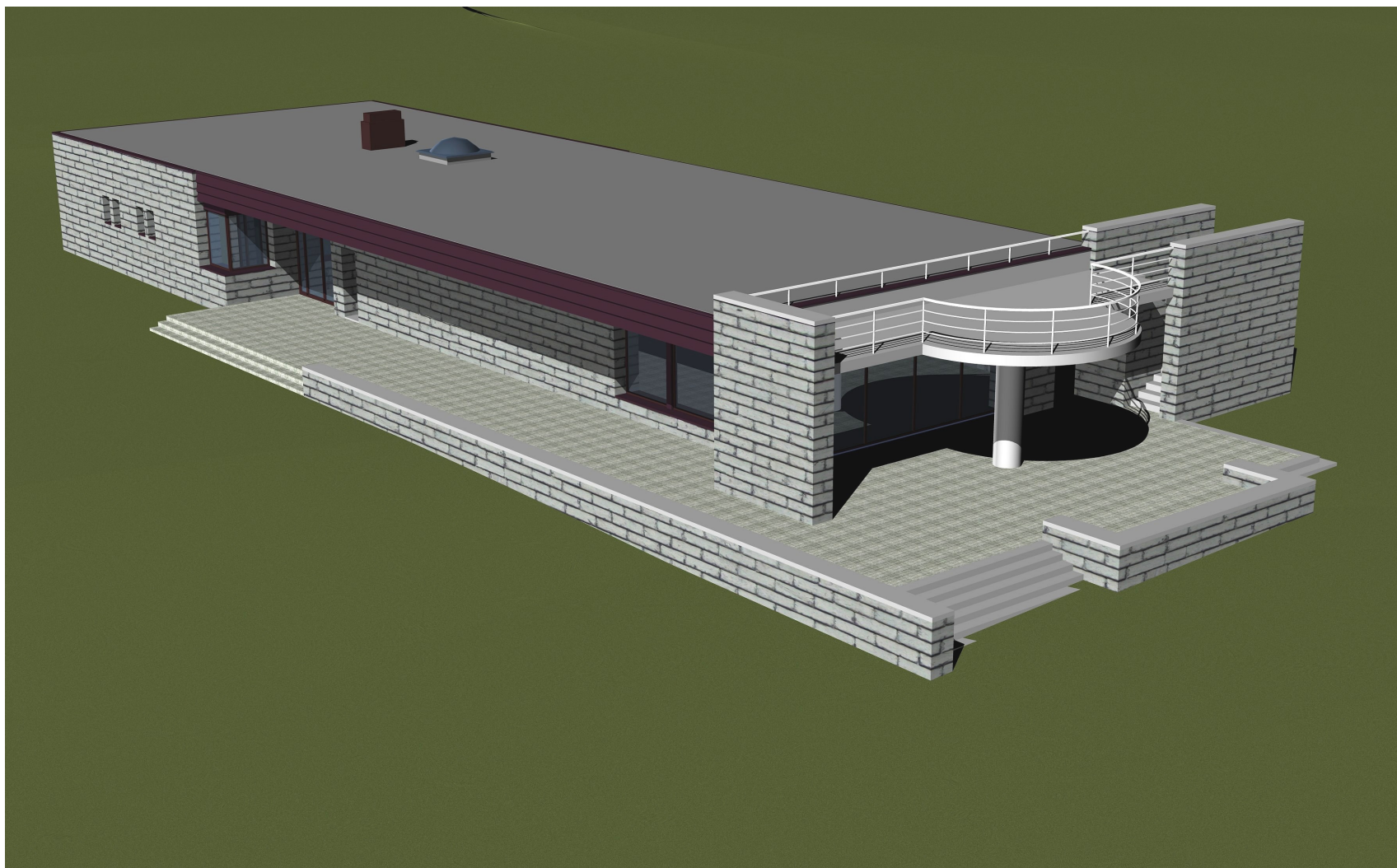
Joonis 1. Kavandatava hoone visualiseering